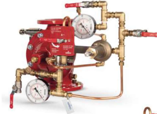
77DE-HRV-MR Manuel Reset

Belgelendirme çalışmaları devam etmektedir.