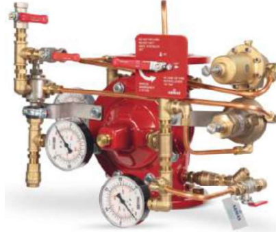
77DE-PORV-PR-MR Manuel Reset

Belgelendirme çalışmaları devam etmektedir.