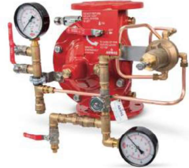
77DE-PN-RR Remote Reset