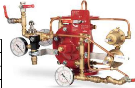
77DE-EL-PORV-PR-MR Manuel Reset