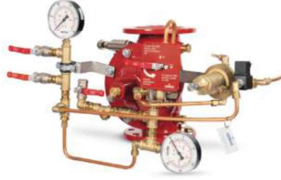
77DE-EL-HRV-MR Manuel Reset

Belgelendirme çalışmaları devam etmektedir.