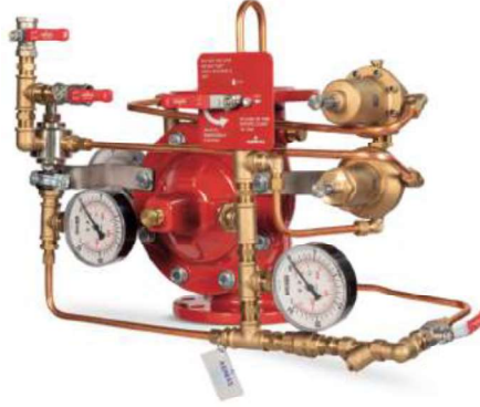
77DE-HRV-PR-MR Manuel Reset

Belgelendirme çalışmaları devam etmektedir.