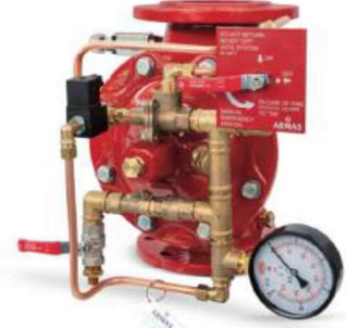
77DE-EL-RR Remote Reset