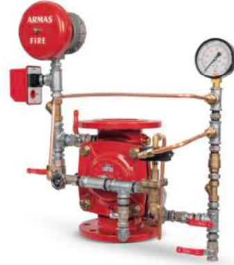
67DE-EL-AL Full Trim Set