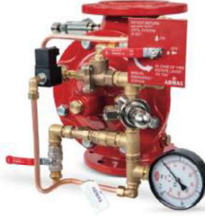
77DE-EL-MR Manuel Reset

Belgelendirme çalışmaları devam etmektedir.