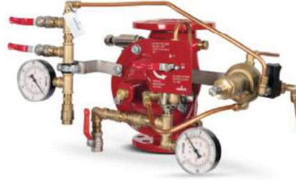
77DE-EL-PORV-MR Manuel Reset

Belgelendirme çalışmalarını devam ettirmektedir.