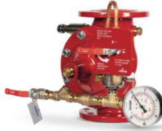
77DE-HM-MR Manuel Reset

Belgelendirme çalışmaları devam etmektedir.