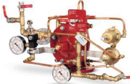
77DE-EL-HRV-PR-MR Manuel Reset

Belgelendirme çalışmaları devam etmektedir.