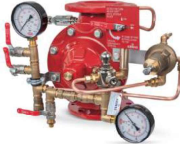
77DE-PN-MR Manuel Reset

Belgelendirme çalışmaları devam etmektedir.